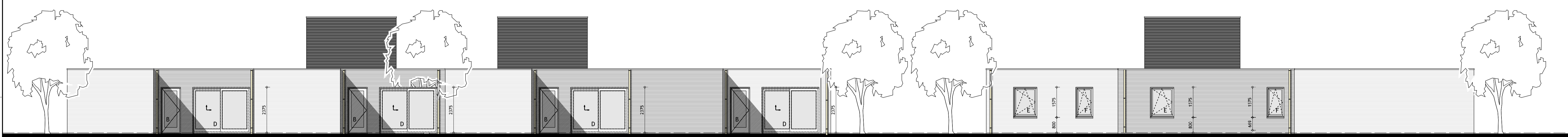
achtergevel woning 1, 2, 3 en 4