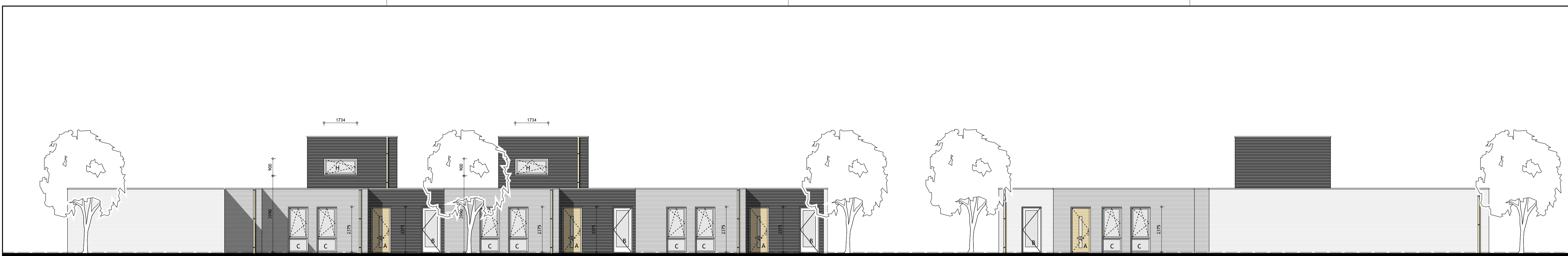
voorgevel woning 1,2 en 3