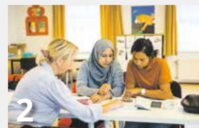
Inburgeren in Gennep