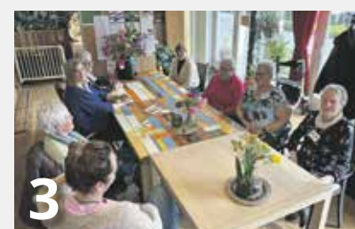
Iedereen is welkom bij Bij 5